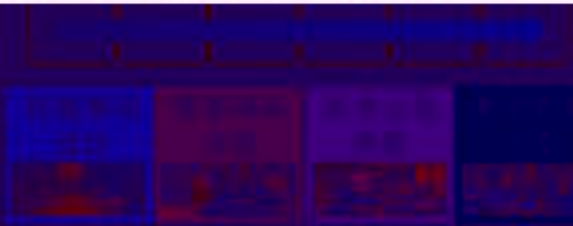
图 赛项开发六步骤